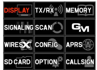
高精細タッチパネル

※2 APRS ® : APRS ® (Automatic Packet Reporting System)は、WB4APR Bob Bruninga氏の商標です。