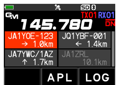
デジタルグループモニター画面