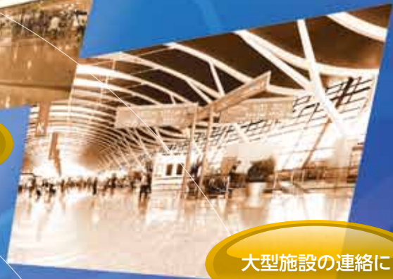
大型施設の連絡に