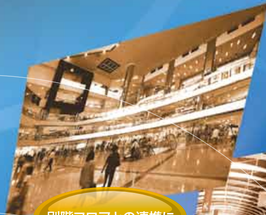
別階フロアとの連携に