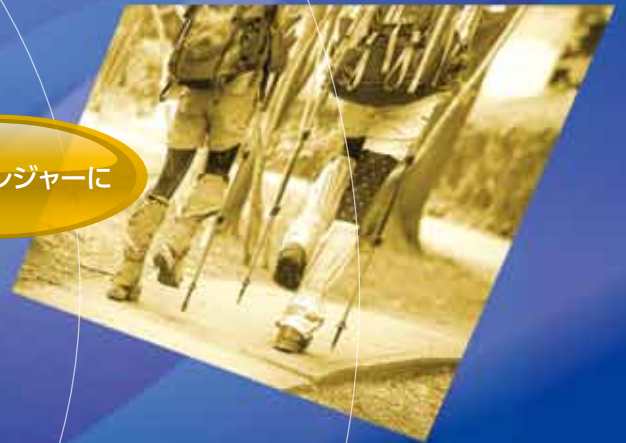
アウトドアレジャーに